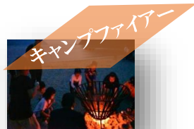
キャンプファイアー

キャンプといえばキャンプファイアー！外国の文化に触れて歌って踊りましょう♪マシュマロ焼きも復活します！