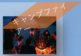
キャンプファイアー

キャンプといえばキャンプファイアー！外国の文化に触れて歌って踊りましょう♪マシュマロ焼きも復活します！